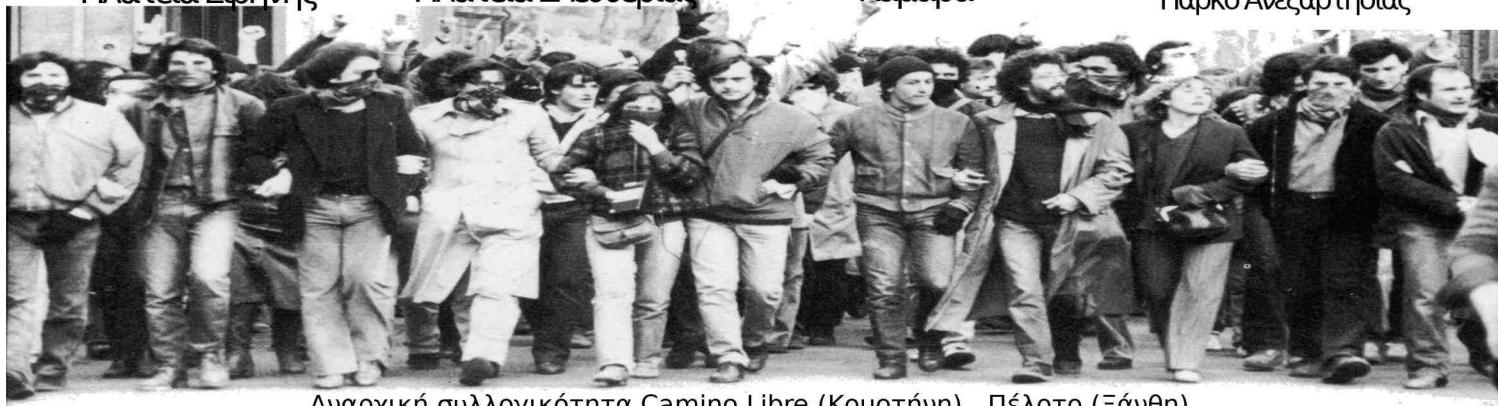
Αναρχική συλλογικότητα Camino Libre (Κομοτηνή), Πέλοτο (Ξάνθη), Ελευθεριακή Πρωτοβουλία Θεσσαλονίκης, Συλλογικότητα αναρχικών από τα ανατολικά (Θεσσαλονίκη)

Κομοτηνή Ξάνθη Θεσσαλονίκη Αλεξανδρούπολη Μικραφωνική παρέμβαση Διαδήλωση Διαδήλωση Διαδήλωση ενάντια στη δημιουργία βάσης του ΝΑΤΟ στην πόλη Σάββατο 6/4 στις 13:00 Σάββατο 6/4 στις 18:00 Σάββατο 6/4 στις 12:00 Σάββατο 13/4 στις 13.00 Πλατεία Ειρήνης Πλατεία Ελευθερίας Καμάρα Πάρκο Ανεξαρτησίας